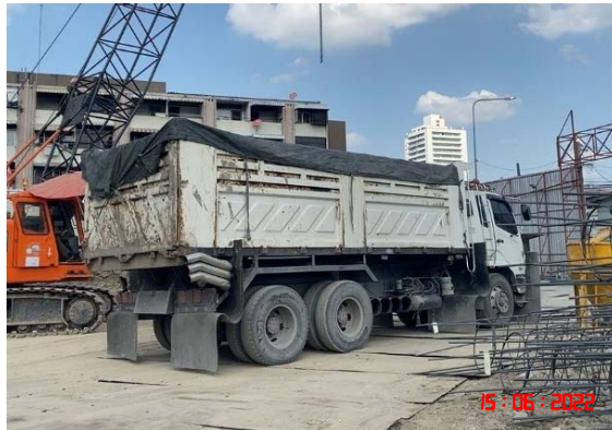
รูปที่ 13 รถรับ-ส่งคนงานก่อสร้าง