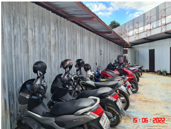
บริเวณพื้นที่จอดรถของโครงการ