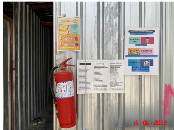
รูปที่ 38 บริเวณจุดรวมพล