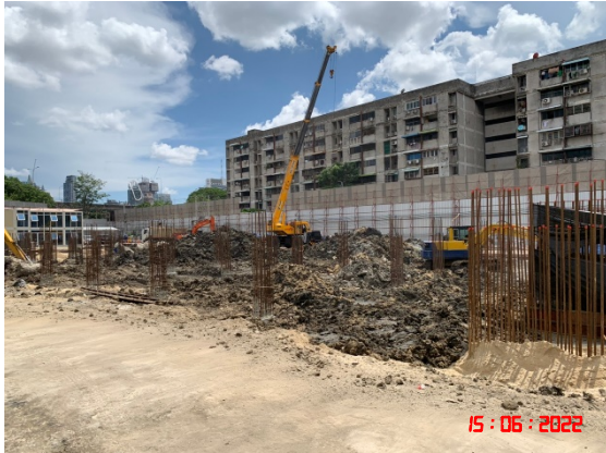
พื้นที่ก่อสร้างโครงการ