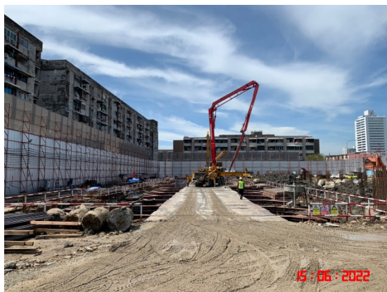
รูปที่ 9 กิจกรรมการก่อสร้างในพื้นที่ก่อสร้างโครงการปัจจุบัน