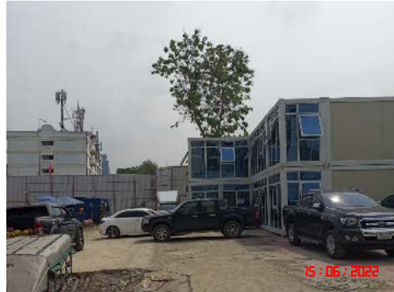
บริเวณสำนักงานโครงการ