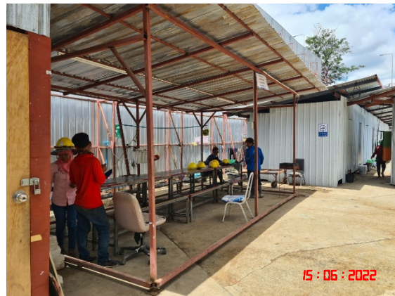
ที่พักพนักงานในช่วงเวลากลางวัน