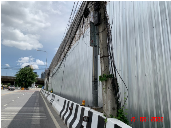
รูปที่ 1 แนวรั้วโดยรอบเขตพื้นที่ก่อสร้างโครงการ